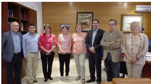
Encuentro con la presidenta del Parlamento