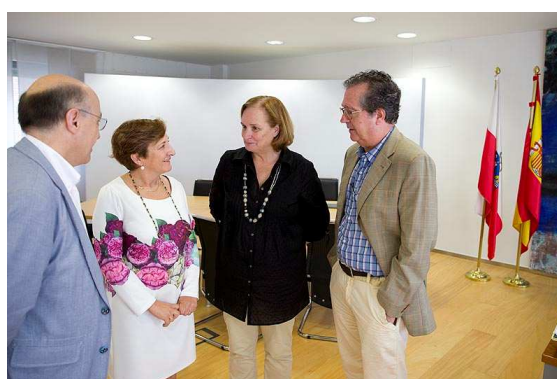
Encuentro con la Consejera de Sanidad