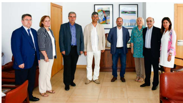
Encuentro con el consejero de Presidencia