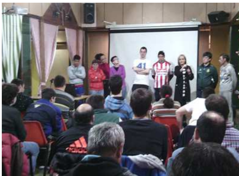
Personas con discapacidad como formadores en la última sesión

Los temas tratados fueron los derechos de los consumidores centrados especialmente en telefonía; contratos fuera del establecimiento mercantil: ventas en casa y en excursiones e Internet. En las dos últimas jornadas un grupo de participantes en las jornadas colaboró con la directora general de Consumo como formadores. En dichas jornadas se aprovechó también para divulgar la Guía de derechos en lectura fácil.