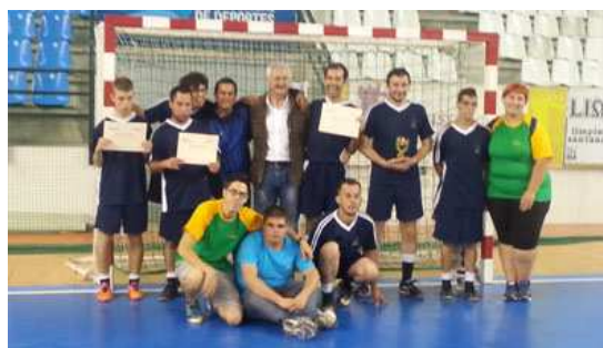
3º clasificado: Equipo AMPROS