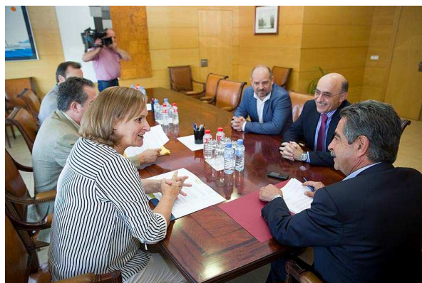
Encuentro con el presidente del Gobierno