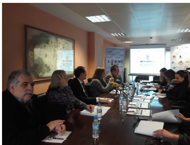
Rueda de prensa sobre la ILP contra el pago confiscatorio

Cantabria, para la recogida de firmas a través de la participación activa de las entidades de CERMI Cantabria, y organizado el 9 y 10 de septiembre dos jornadas en la calle para la captación de firmas, una en Santander y otra en Torrelavega.