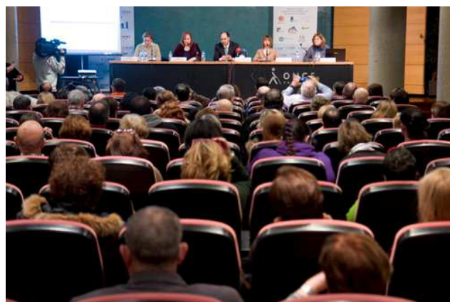
Charla sobre medidas fiscales en Santander