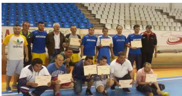
2º clasificado: Equipo ASCASAM A