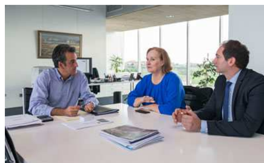
Encuentro con el consejero de Industria