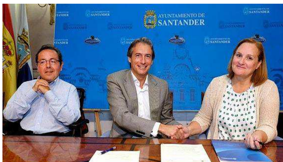
Firma de convenio de colaboración con el ayuntamiento de Santander