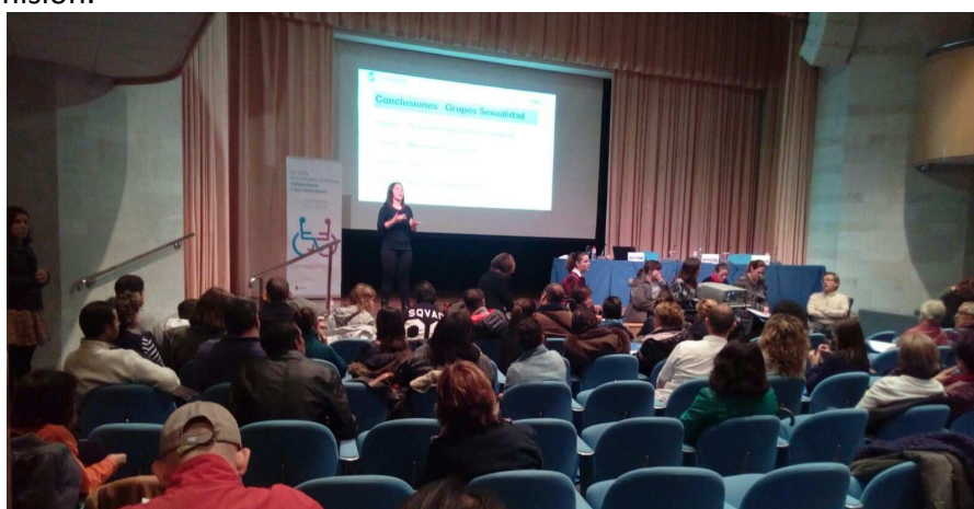
Puesta en común de los grupos de trabajo del Aula sobre sexualidad y discapacidad