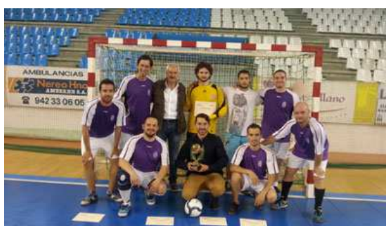
Campeón: Equipo FESCAN-ASSC