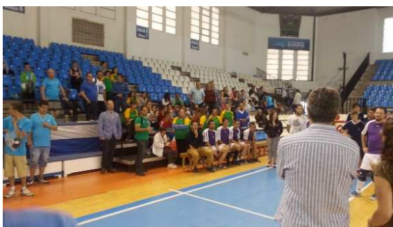
Acto de entrega de trofeos

El campeón de la Liga fue el equipo de FESCAN-ASSC, quedando en segundo lugar el equipo de ASCASAM A y en tercero el equipo de AMPROS.