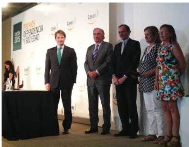
Acto entrega Premios CASER