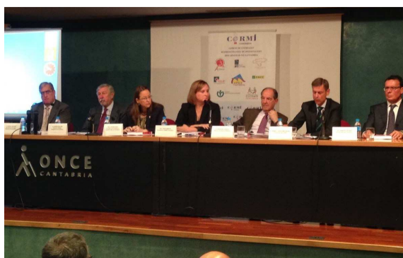
Jornada para profesionales

Curso de formación a familias, técnicos y colectivos profesionales. Se llevó a cabo una jornada los pasados días 15 y 16 de junio, la primera “Hacia la igualdad en la Capacidad Jurídica de las personas con discapacidad” dirigida al colectivo de juristas y profesionales en general y la segunda “SOLUCIONES JURÍDICAS PARA LA DEFENSA Y PROTECCIÓN DE LOS DERECHOS DE LAS PERSONAS CON DISCAPACIDAD” a familias y personas con discapacidad y profesionales, realizándose una en Santander y otra en Torrelavega.