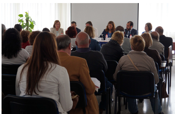
Jornadas en Santander y Torrelavega con familiares y personas con discapacidad