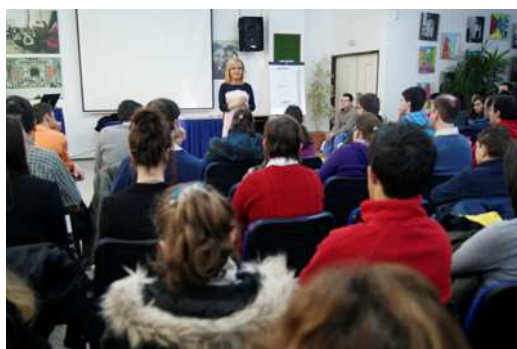
Primera jornada en Torrelavega