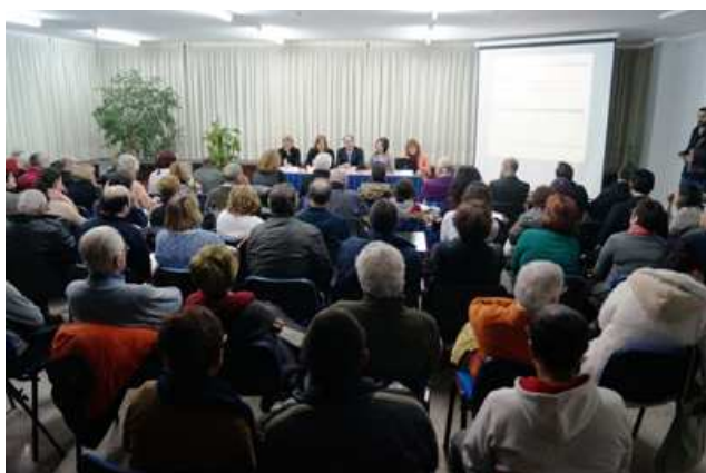
Charla sobre medidas fiscales en Torrelavega