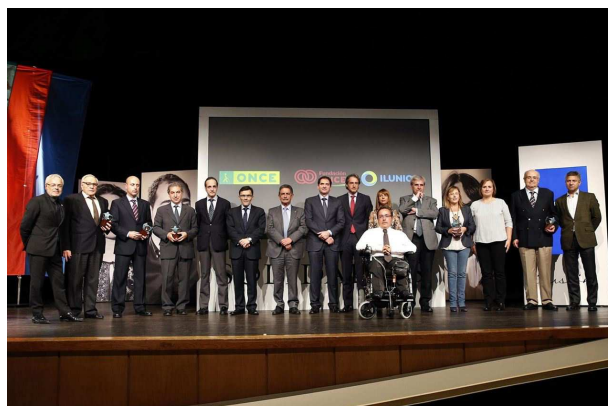
Acto entrega Premios solidario de la ONCE