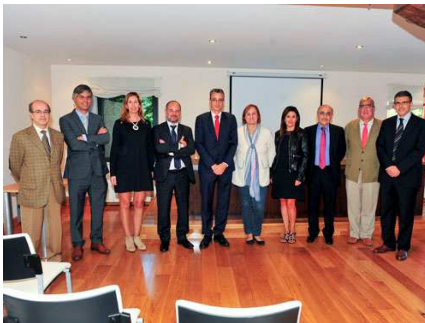
Miembros del colegio de Notarios y de CERMI Cantabria