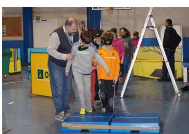
Jornada de sensibilización con escolares del ayuntamiento de Los Corrales de Buelna