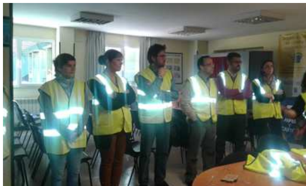
Visita al centro Entorno de Amica