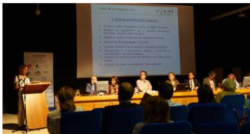
Asamblea General de CERMI Cantabria

CERMI Cantabria celebró además el 9 de junio su Asamblea anual ordinaria, y una extraordinaria, a la que por primera vez se convocó también a las entidades que forman parte de sus federaciones y a los miembros de las comisiones de trabajo.