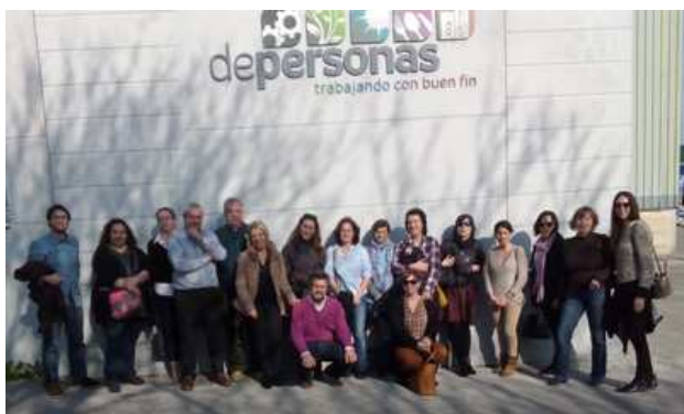
Visita al centro ocupacional y de empleo de AMPROS