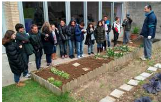
Visita al Centro de Recursos Agustín Bárcena

Los temas tratados fueron los derechos de los consumidores centrados especialmente en telefonía; contratos fuera del establecimiento mercantil: ventas en casa y en excursiones e Internet. En las dos últimas jornadas un grupo de participantes en las jornadas colaboró con la directora general de Consumo como formadores. En dichas jornadas se aprovechó también para divulgar la Guía de derechos en lectura fácil.